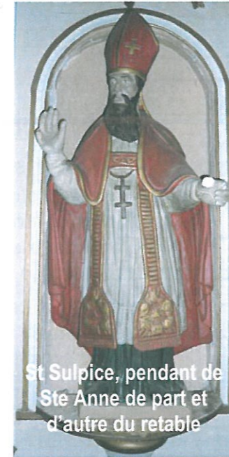
St Sulpice, pendant de Ste Anne de part et d'autre du retable

En 1997, réfection de la toiture de la nef.