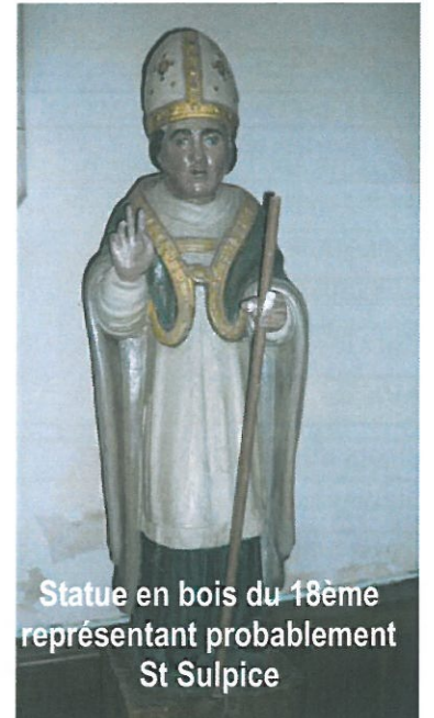
Statue en bois du 18ème représentant probablement St Sulpice

Né à Vatan dans le Berry dans une famille noble gallo-romaine, il fut éduqué à l'école du Palais. Il aimait soulager les malheureux et prendre soin des pauvres. Il faisait restaurer les églises détruites par les guerres. Sulpice passa toute sa vie, malgré ses charges officielles auprès du roi, dans la pauvreté, l'austérité, effectuant de nombreuses conversions, et prenant soin des indigents. Il est fêté le 17 janvier.