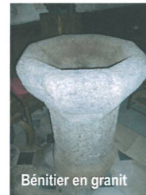
Bénitier en granit